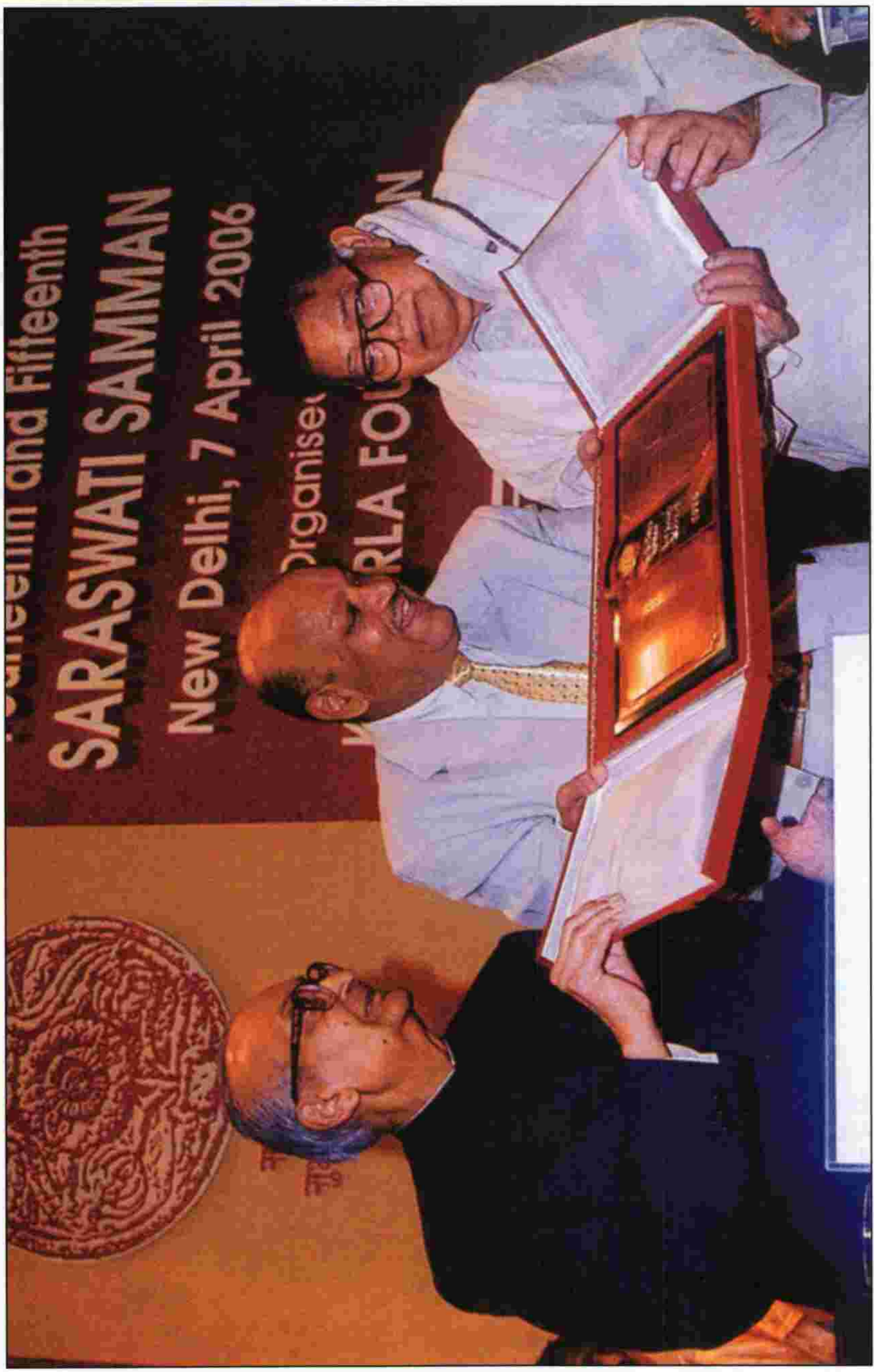
సరస్వతి సమ్మాన్ కు ఇచ్చే జ్ఞాపిక