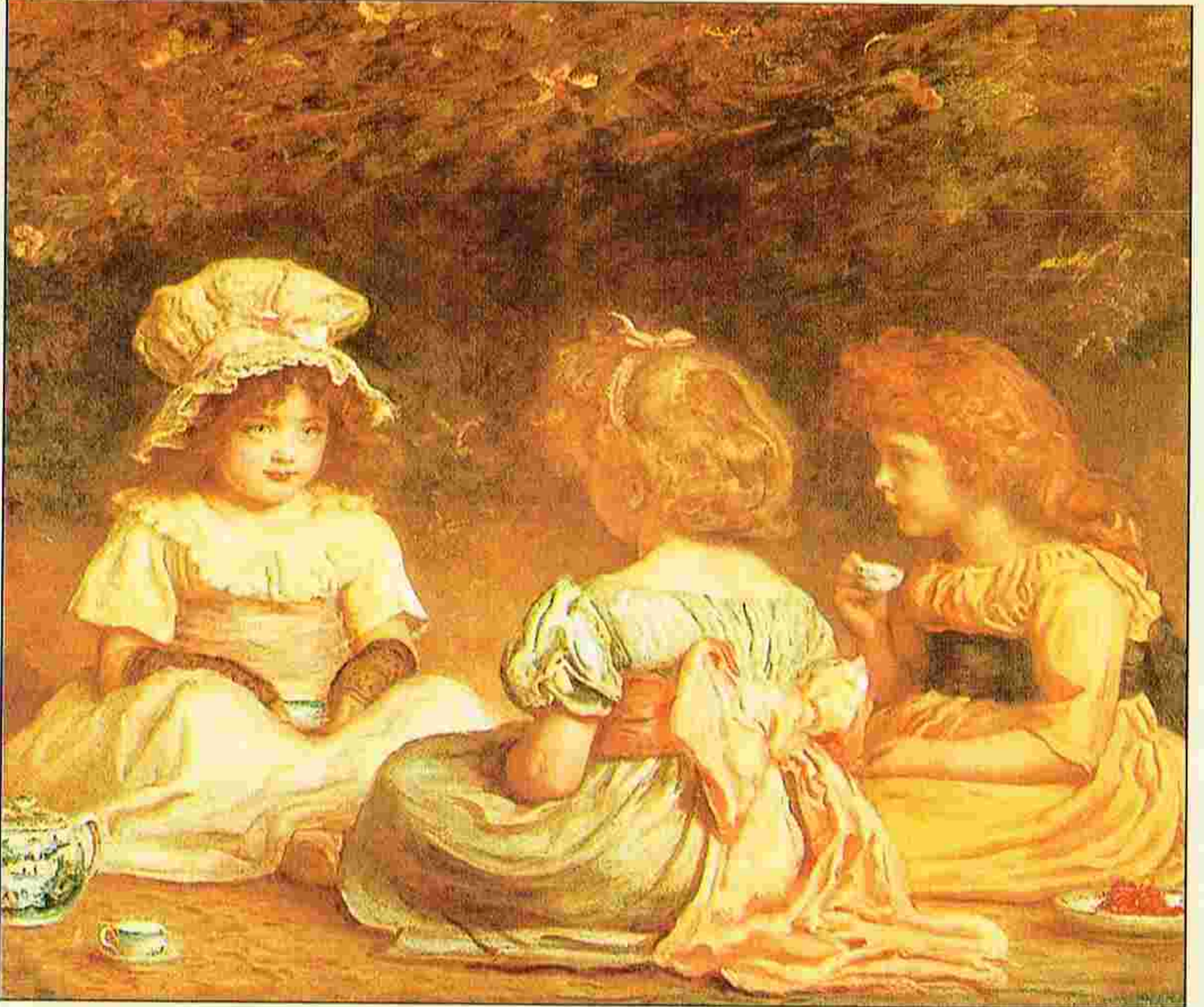
సాయంకాలపు తేనీటి విందు