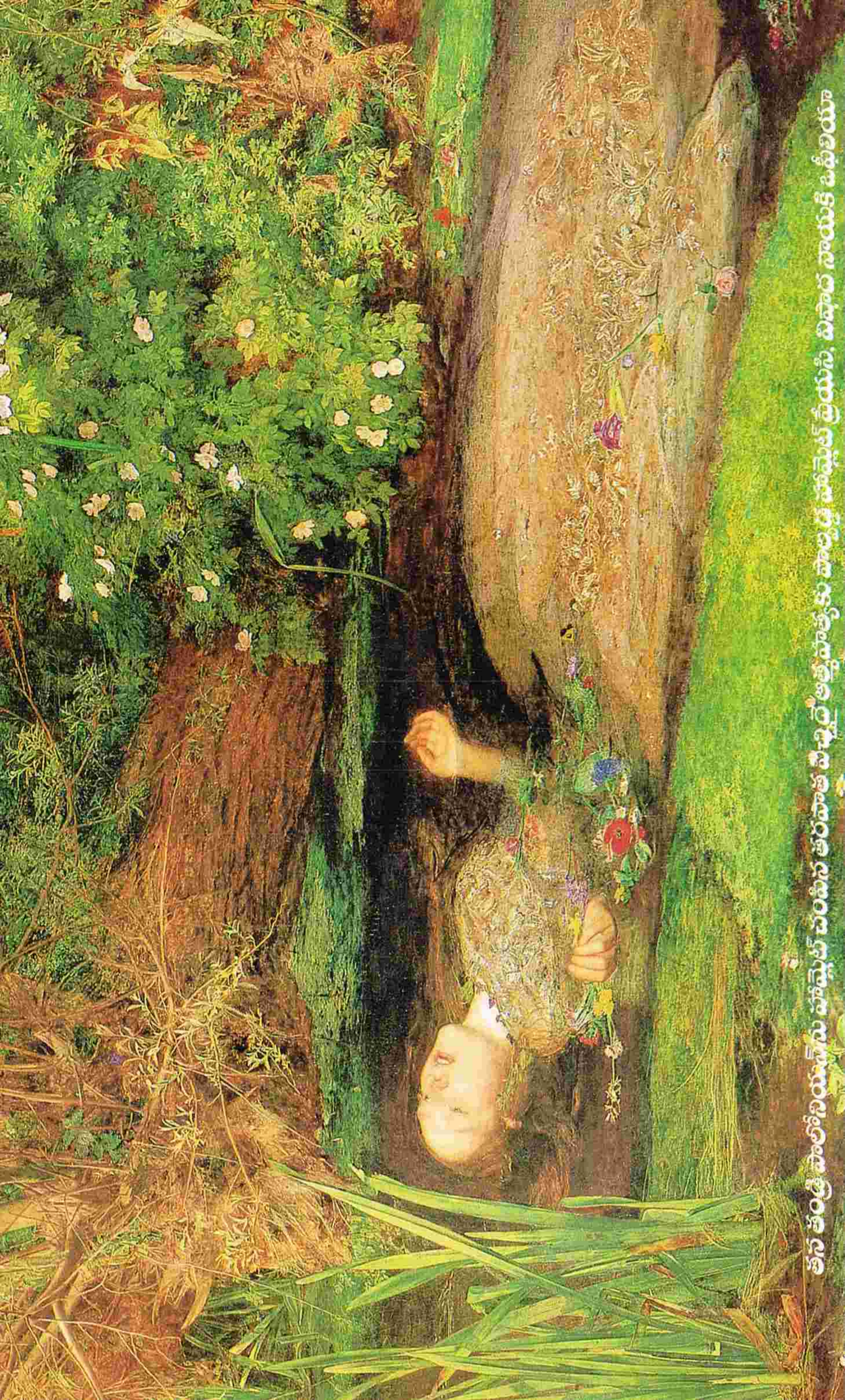
తన తండ్రి బొలలోని యువ్వను హోమ్లెట్ చంపిన తరువాత విచ్చింద్ర అత్తపాత్యకు పాల్కుడ్ల హోమ్లెట్ ప్రేయసి, విషాద నాయుకి ఒప్పిలియా