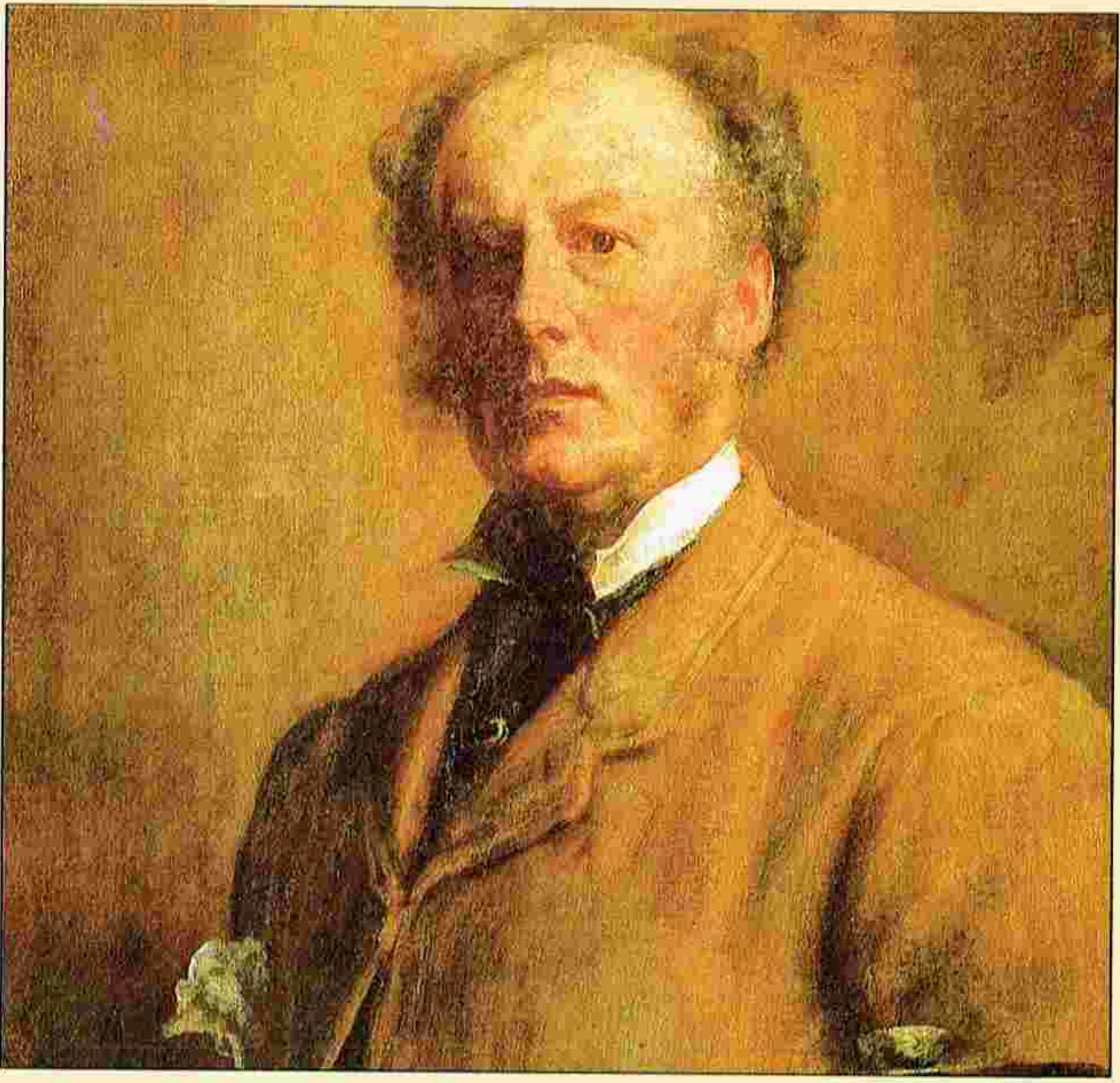
చిత్రకారుడు : మిలేస్ (1829 - 1896)