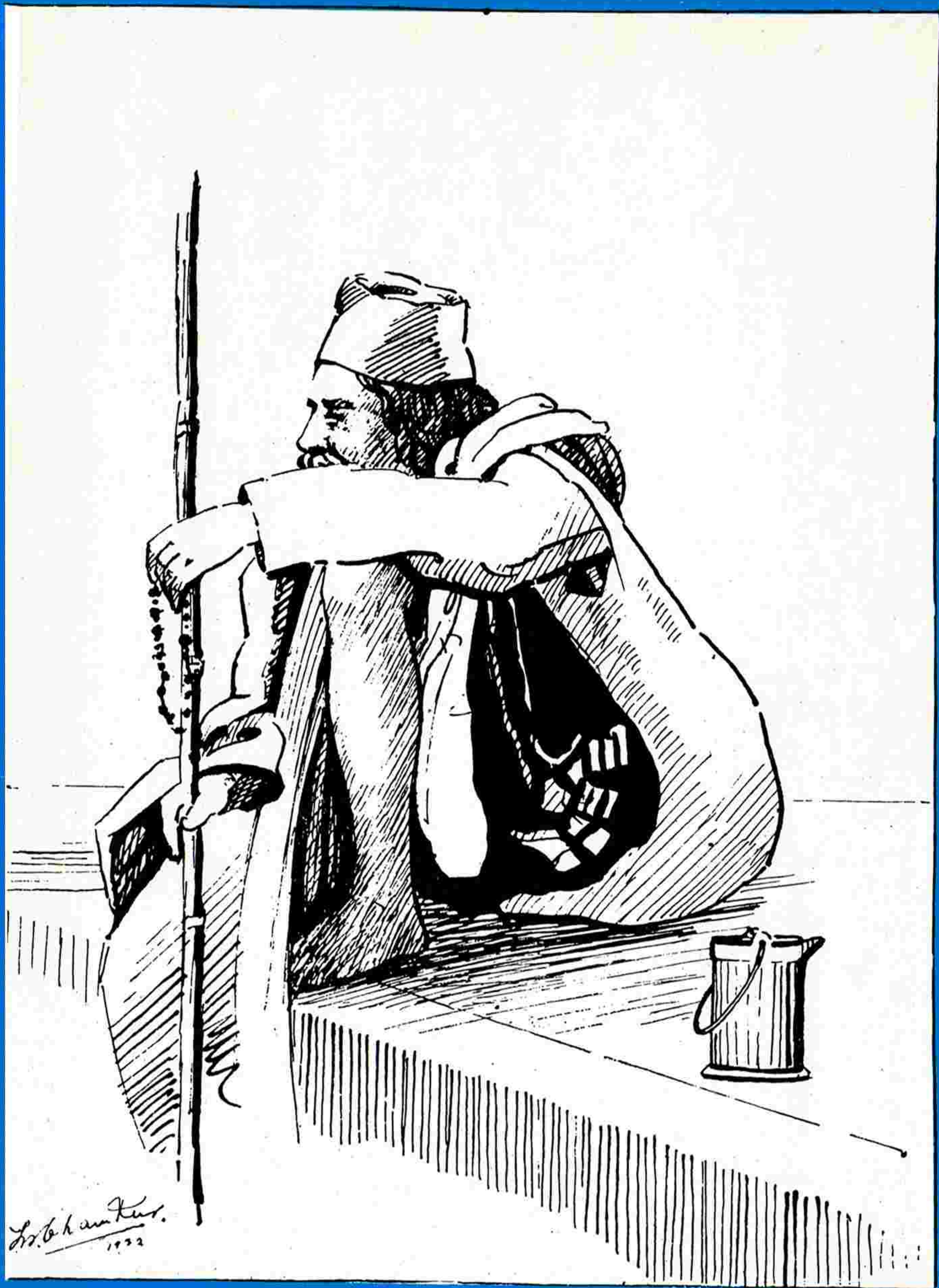
AN OLD FAKIR By S.N. CHAMKUR